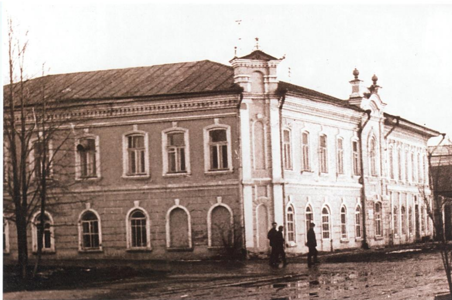
В этом здании Марийского областного суда в феврале 1927 года состоялось организационное собрание Краснококшайского городского совета

17 февраля 1927 года в здании областного суда состоялось организационное собрание городского совета нового состава. В горсовет было избрано 96 членов и 36 кандидатов. Газета «Марийская деревня» от 22 февраля 1927 года писала: «ВНОВЬ избранные депутаты собрались сконструировать